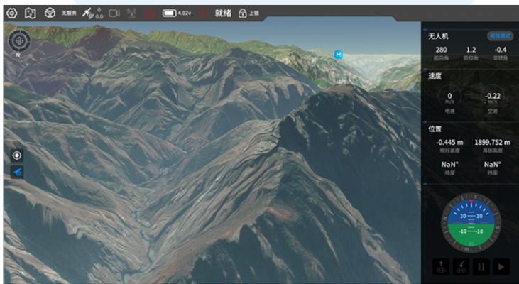
▲ 三维卫星地图操作界面

借助极简操纵设计SVO (Simplified Vehicle Operation) ,将飞行操控简化为只需轻点目标地点，无人机即可自动飞抵目标。即使是从未有过无人机遥控操控经验的任务执行人员，亦能快速上手。得益于数字孪生技术的应用，SVO可实时显示三维飞行轨迹及周围环境的三维重建模型，为不同的任务场景提供了更加丰富的可视化信息。